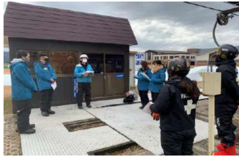
【冬季シーズン前救助訓練】