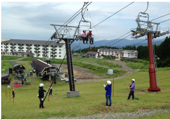
【夏季勤務前救助訓練】