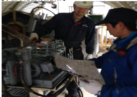
【予備原動機切替訓練】