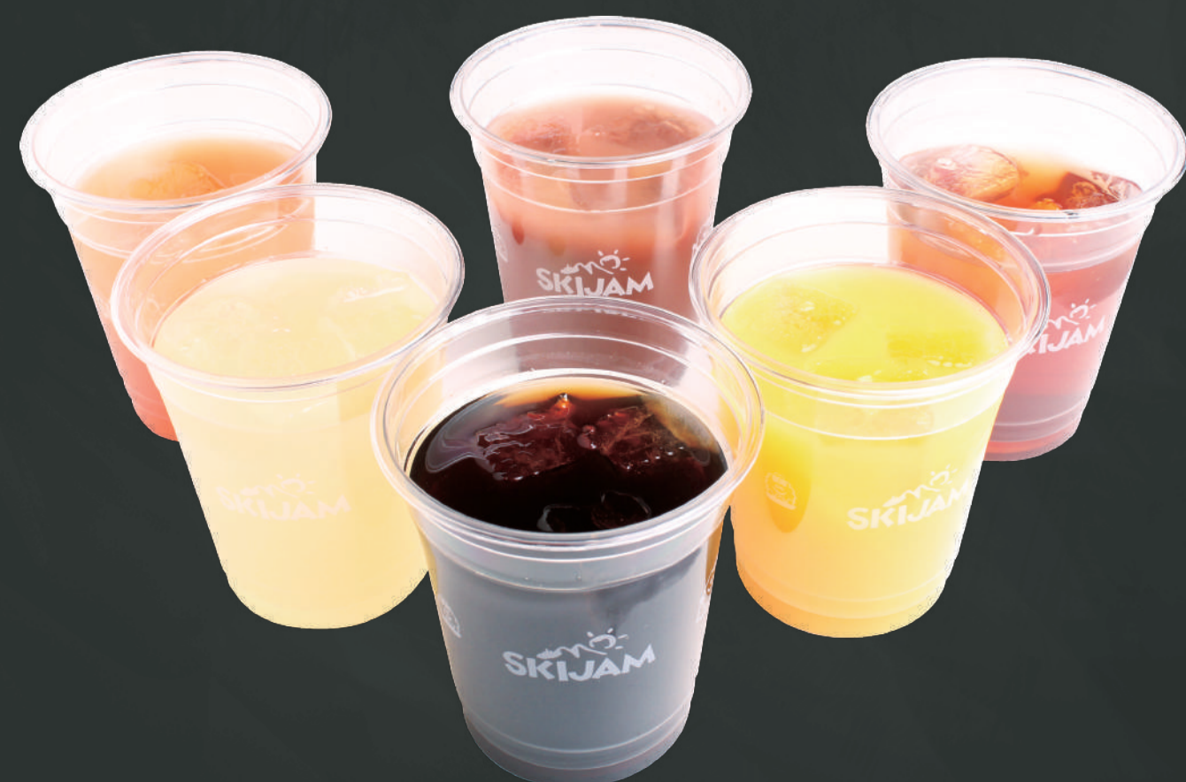
ソフトドリンク (M) ¥300 (L) ¥400 ペプシコーラ・メロンソーダ・白ぶどう・アップル・オレンジ・アップルソーダ・ウーロン茶