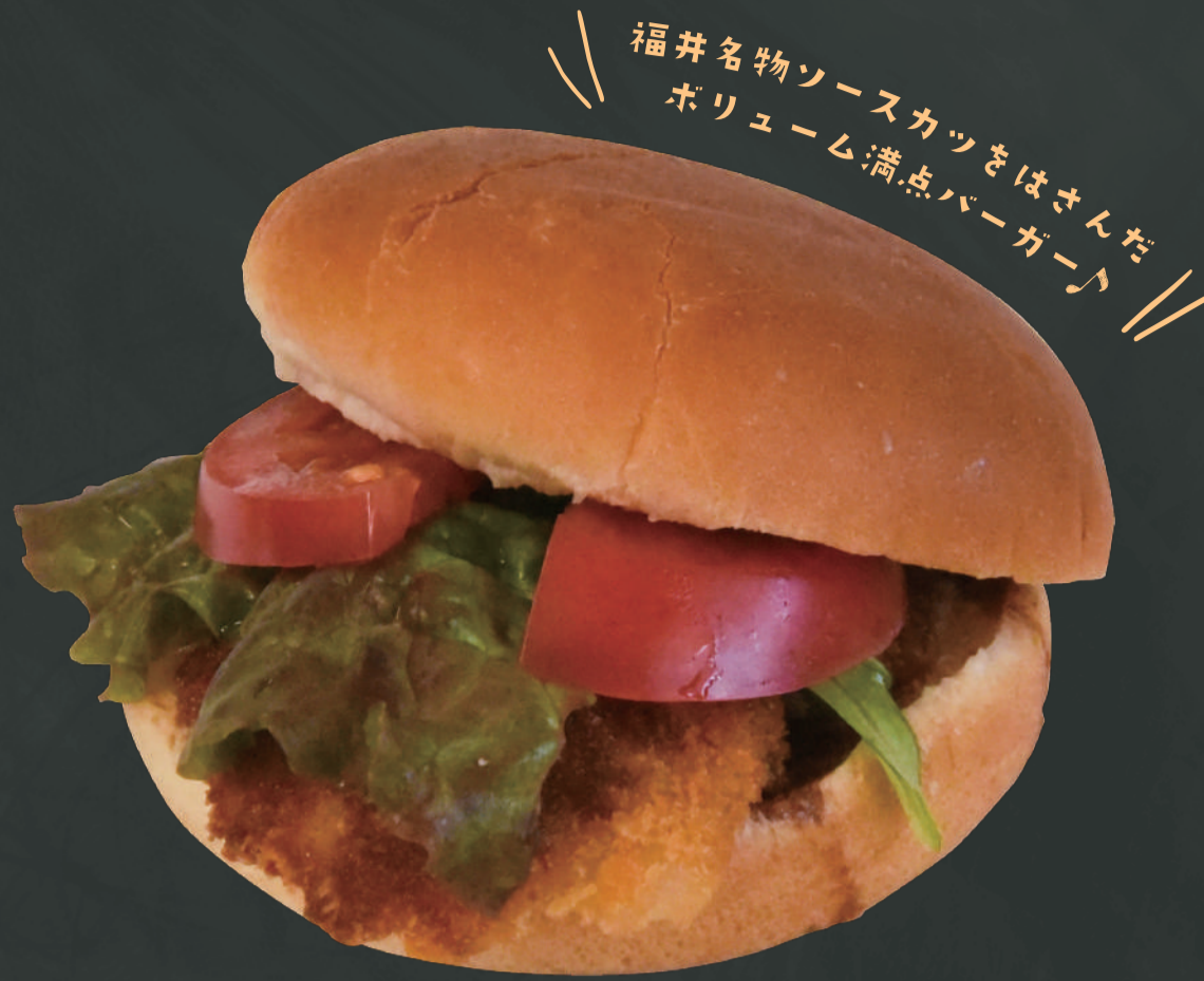
ソースカツバーガー ¥700

ポテト&ドリンクセット・・・ ¥1100 ドリンクサイズorレモネードに変更 ⬆ ¥50 プレミアムレモネードに変更 ⬆ ¥100