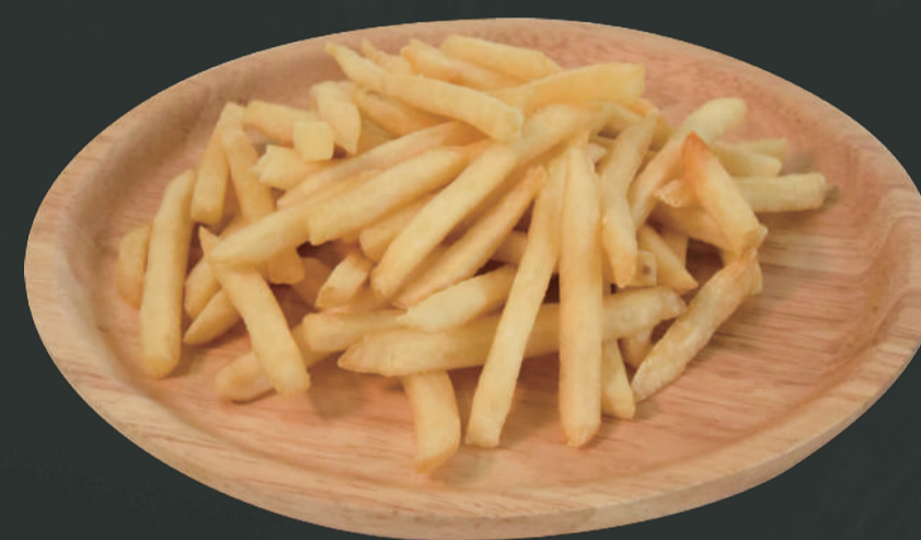
フライドポテト ¥350 (M) ¥600 (L) ※ご提供時はテイクアウト袋でのお渡になります