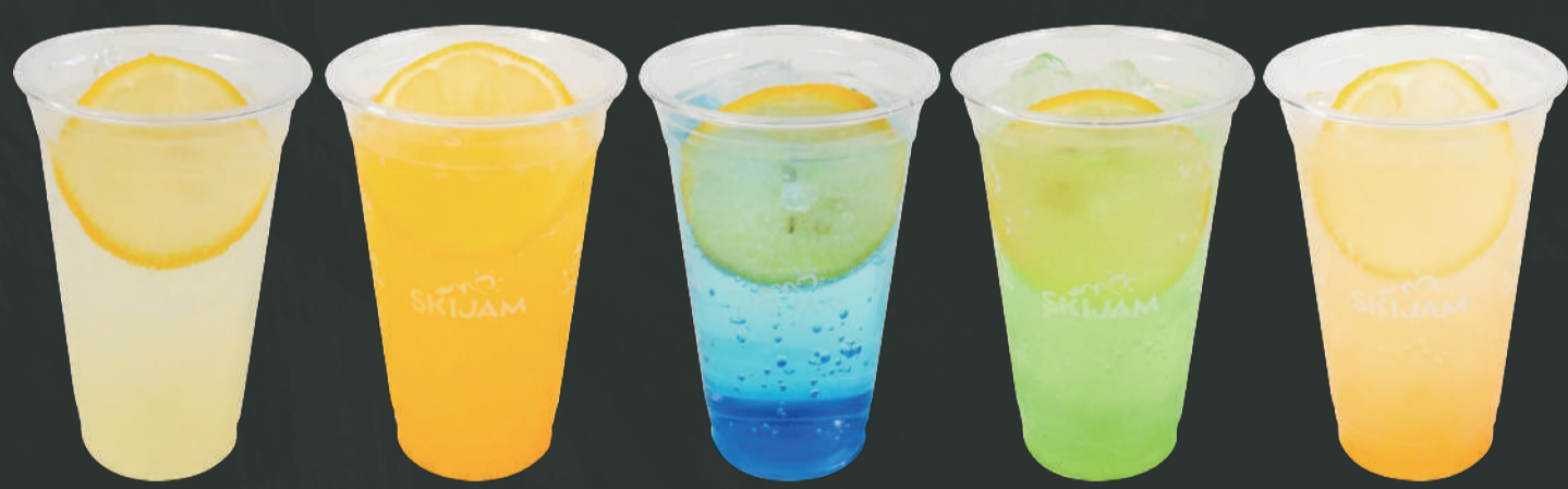
レモネード 各¥350 レモネード・ぽんかんレモネード・ブルーネモネード マスカットレモネード・アップルレモネード