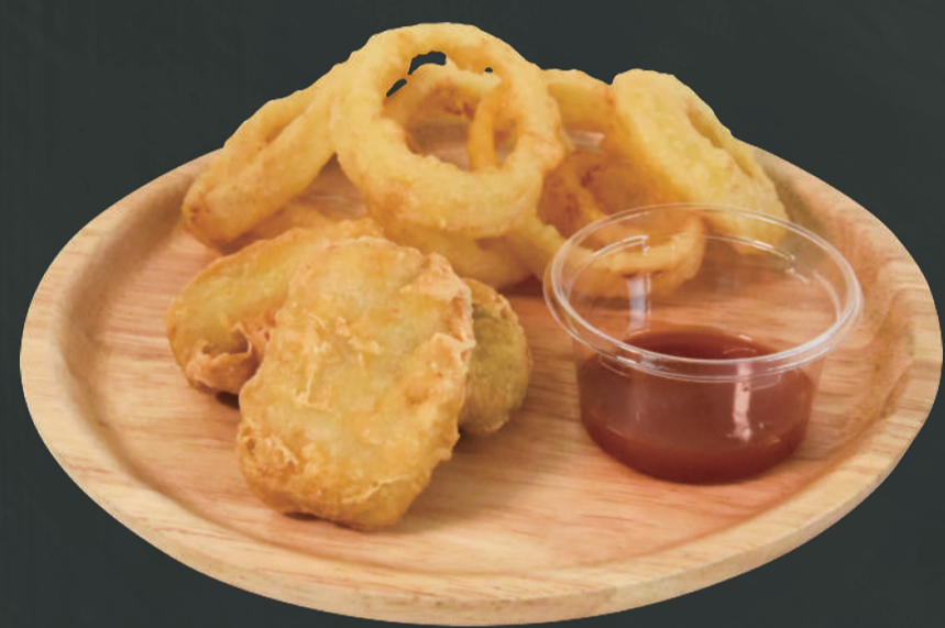
フィッシュ & オニオン ¥650 ※ご提供時はテイクアウト容器でのお渡になります

ポテト&ドリンクセット・・・ ¥1100 ドリンクサイズorレモネードに変更 ⬆ ¥50 プレミアムレモネードに変更 ⬆ ¥100