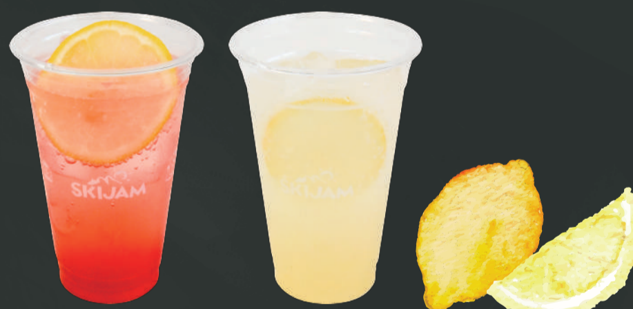
PREMIUMレモネード 各¥400 あまおういちごレモネード・ジンジャーレモネード