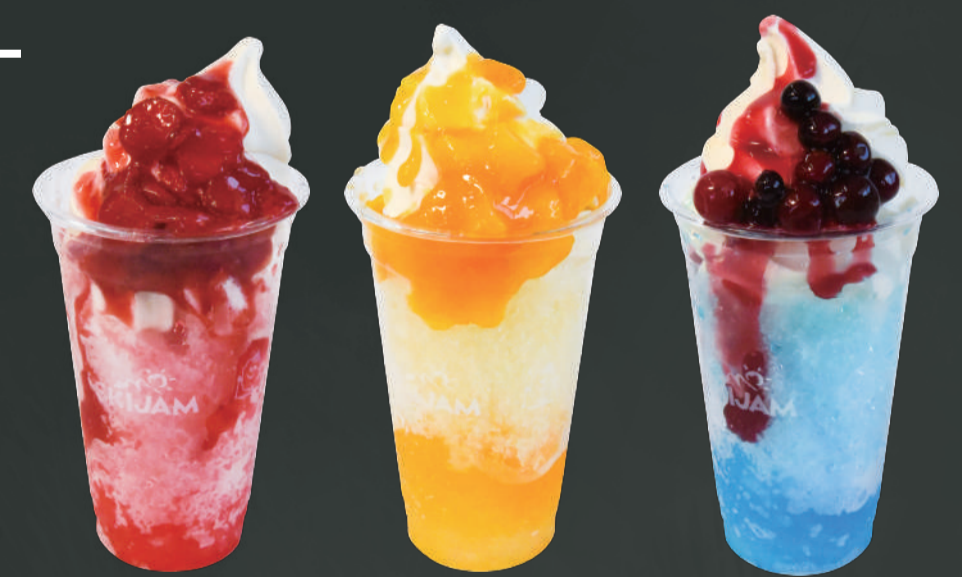
氷フロート 各¥650 ストロベリー・マンゴー・ミックスベリー