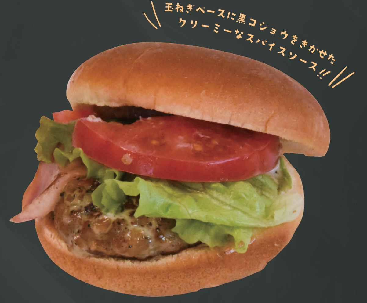
スパイスバーガー ¥700

ポテト&ドリンクセット・・・ ¥1100 ドリンクサイズorレモネードに変更 ⬆ ¥50 プレミアムレモネードに変更 ⬆ ¥100